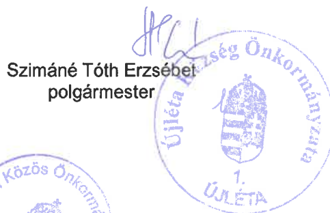
Szimáné Tóth Erzsébet polgármester